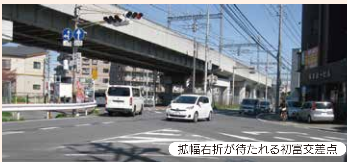
拡幅右折が待たれる初富交差点

高齢化に伴い身体の都合で「投票に行けない」高齢者が 増加しています。移動投票所や駅前投票所等の代替策を研 究検討し、「投票に行きたくても歩いて行けない」状況の 解決に取り組みます。